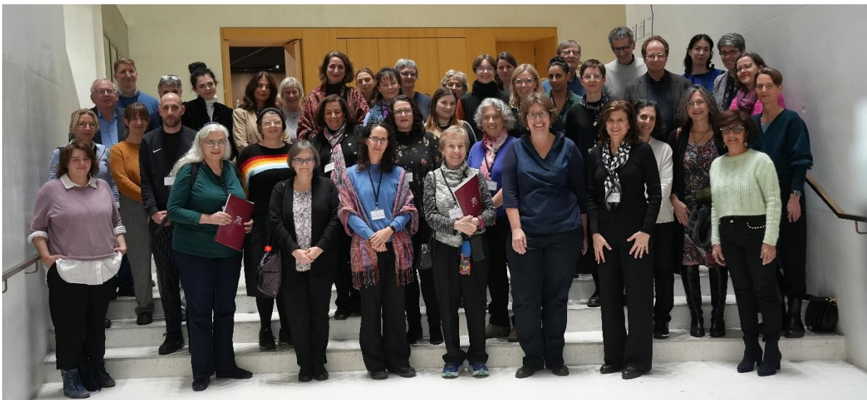
„Die Teilnehmenden der Konferenz „Revisiting Jewish Feminism“ im Jüdischen Museum Frankfurt. “